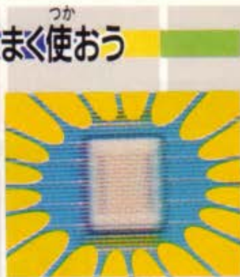
せつめい ふくごう

タイルの中には、点滅する「ワイルドタイル」というものがあります。これは要するにオールマイティタイルで、どの色としても使うことができます。ピンチのときや、12Pで説明する複合クラックスを狙うときなど、きっと役立つでしょう。